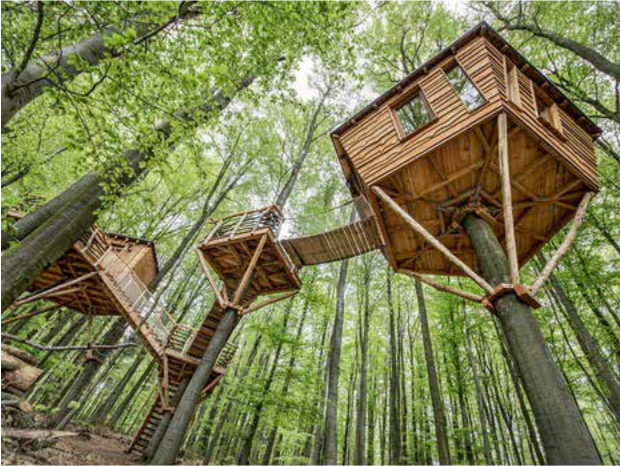
Nur eines von vielen schicken Luftschlössern: Die Baumhausherberge Robins Nest.